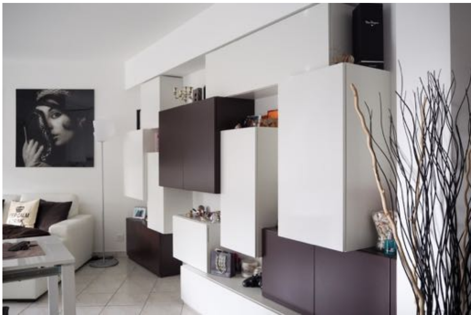
Mobili creati su misura (libreria, mobile TV, mobile wi-fi)